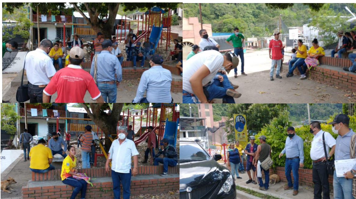
Figure 6: Registros fotográficos entrega biofertilizantes veredas contiguas al corregimiento de Pto. Saldaña pero que son jurisdicción del Municipio de Ataco

Sobre las tres y treinta de la tarde del día 4 de noviembre se realizó la reunión de asistencia, asesoría, capacitación y entrega de suministros, la asesoría y asistencia técnica estuvo a cargo del Profesional de la SDA Y PA y acompañó la UMATA del municipio y el mismo señor alcalde, el profesional de la Secretaria de Inclusión Social adelanto una asesoría y asistencia jurídica a las víctimas del conflicto armado de la asociación ASOVITOL a quienes finalmente se les hizo entrega de 8.5 toneladas del biofertilizante.