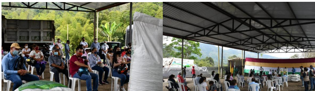
Figure 5: Registros fotográficos entrega de biofertilizantes municipio del Libano

Finalmente, se cumplió con todas las garantías biosanitarias y de salud y el evento, aunque fue lento, garantizó a las beneficiarias espacios acordes a la necesidad, sillas individuales y distanciadas y total comodidad para recibir la capacitación/asesoría y posterior entrega del biofertilizante, y se está pendiente del retiro de 80 de las 120 toneladas asignadas una vez la compañía avícola triple A lo disponga.