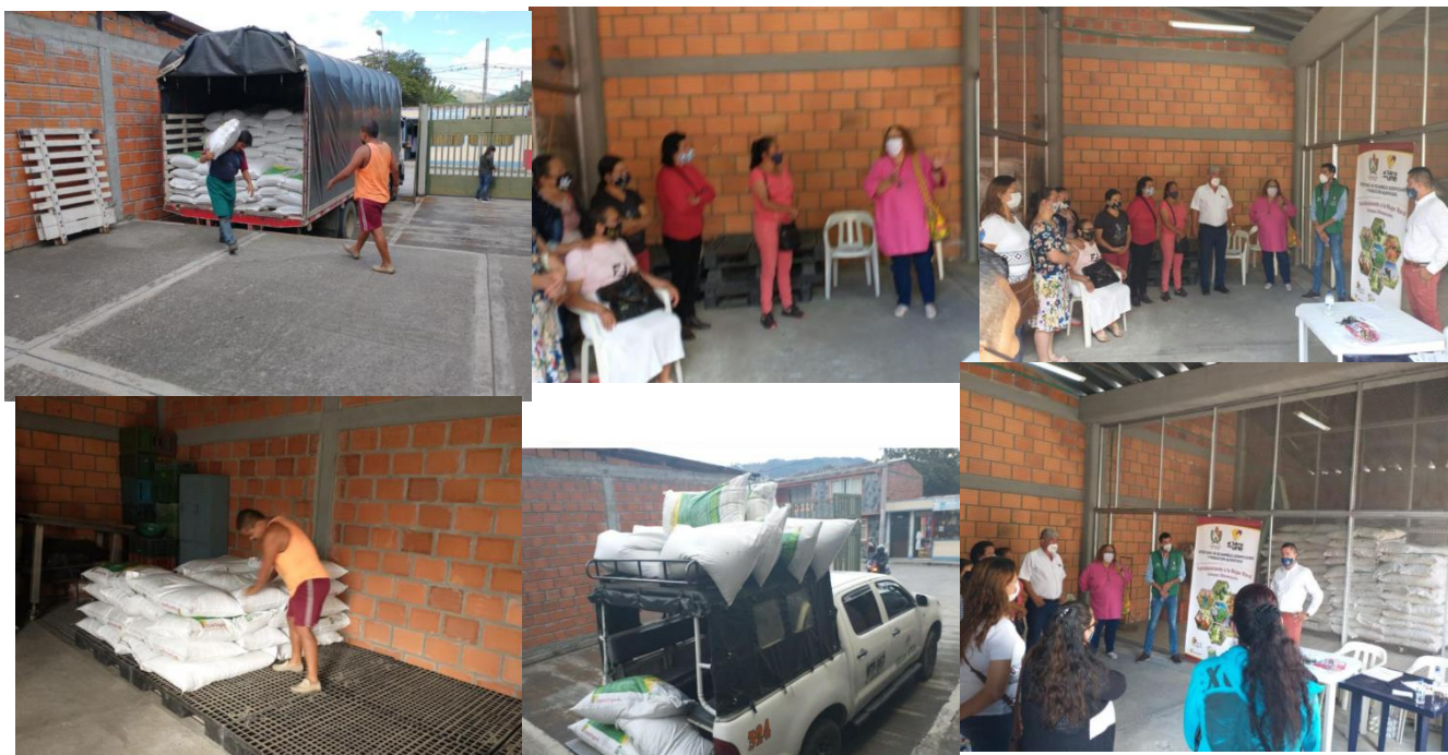
Figure 3: Registros fotográficos entrega de biofertilizantes municipio de Cajamarca

En la entrega en este municipio se hizo la presentación del producto y sus bondades por parte de la Compañía Avícola triple A, igualmente asistencia técnica en cuanto a uso del producto, cuidados y cantidades según producto a cargo del Funcionario de la Secretaria de Desarrollo Agropecuario y Producción Alimentaria del Tolima y que acompañó el director de la UMATA y su equipo de trabajo, adicional a ello el Banco Agrario acompañó la actividad con la entrega de algunas herramientas entregada a las agro productoras.