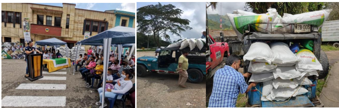
Figure 8: Registros fotográficos entrega biofertilizante municipio de Fresno en tres puntos diferentes, Casco urbano, el mirador y el palo.

En el avance de las entregas de este municipio se esta haciendo el cubrimiento de seis (6) asociaciones de productores agropecuarios y dos (2) asociaciones de victimas del conflicto armado interno