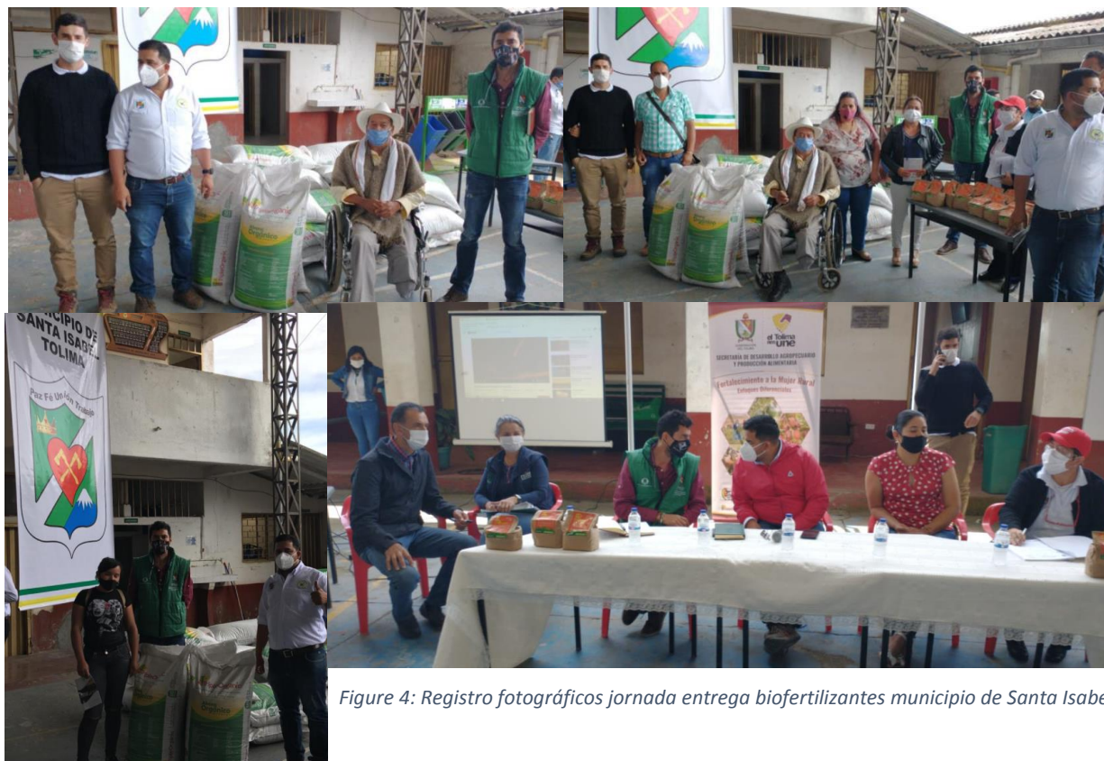
Figure 4: Registro fotográficos jornada entrega biofertilizantes municipio de Santa Isabel

20 DE OCTUBRE se lleva a cabo la firma del acta de voluntades firmada entre la Compañía Avícola Triple A y la Secretaría de Desarrollo Agropecuario y Producción Alimentaria.