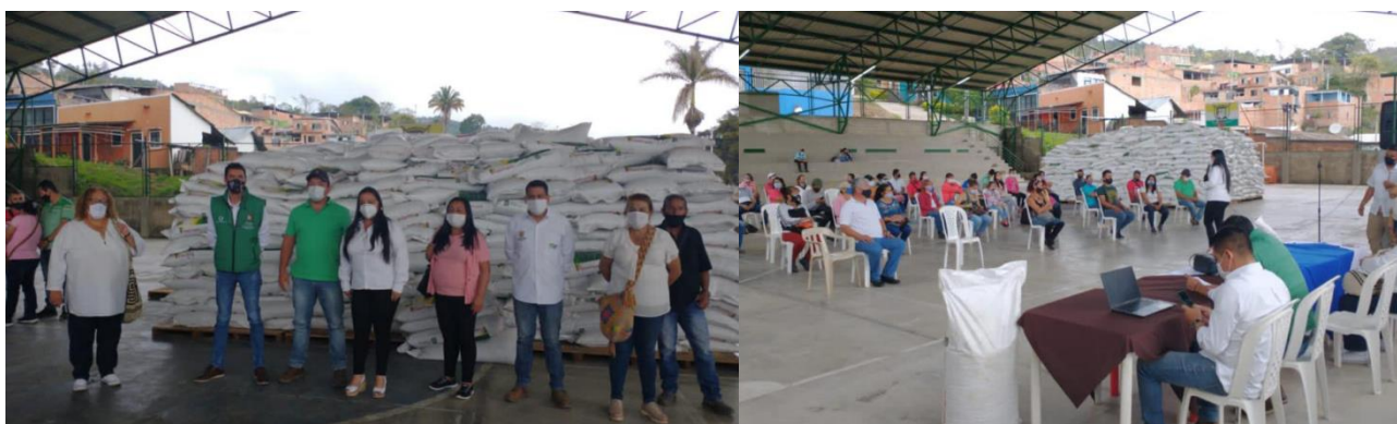
Figure 9: Registros fotográficos entrega del producto biabono TRIPLEORGANIC municipio de Icononzo

además de haberse invitado a las 7 personas que integran la mesa de víctimas del municipio, los y las presidentes de las asociaciones productoras del municipio, seis (6) organizaciones en total entre ellas dos asociaciones de mujeres víctimas del conflicto armado interno, se benefician 342 familias de este municipio.