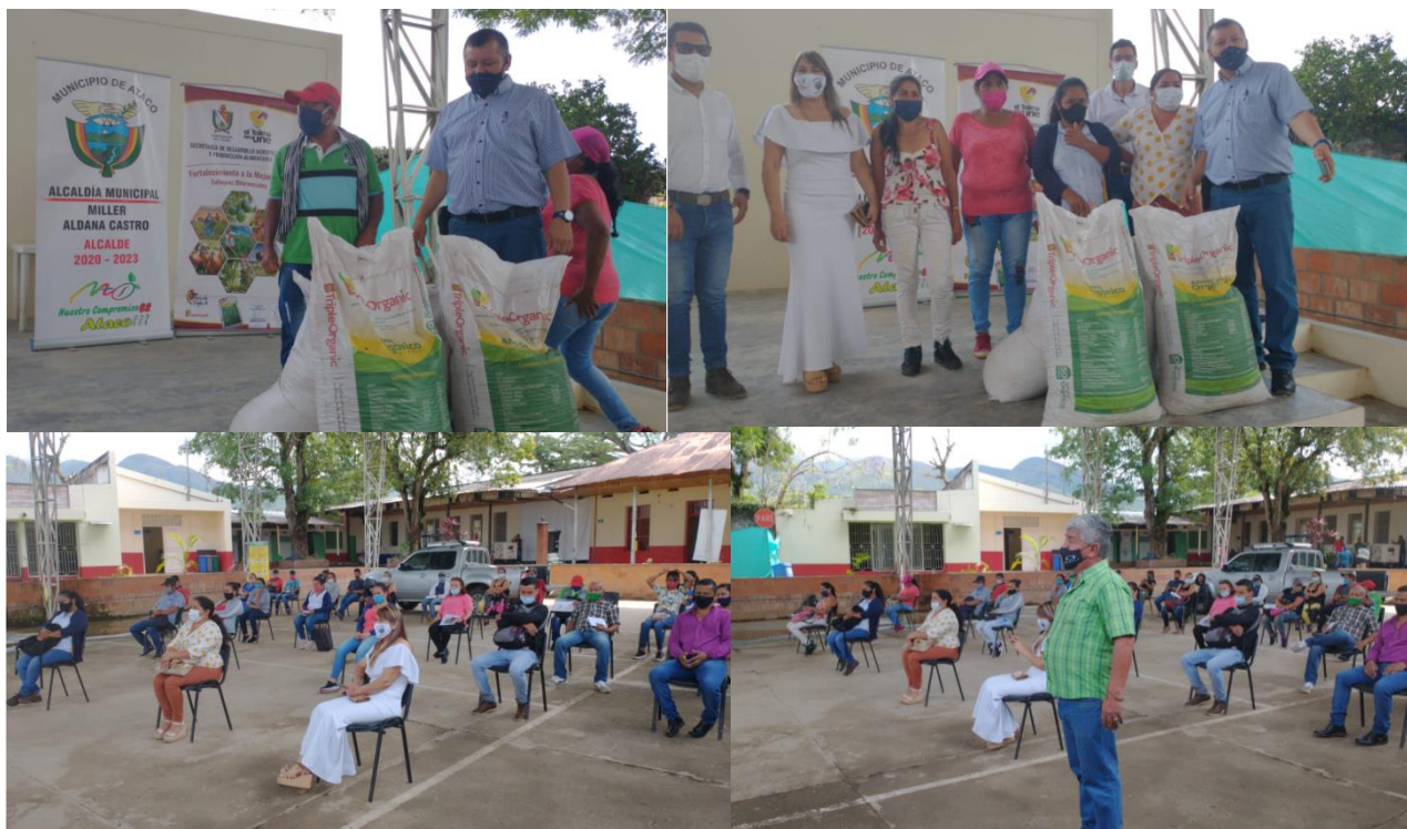
Figure 7: Soportes fotográficos entrega de biofertilizante TRIPLEORGANIC cabecera municipal ATACO

biofertilizante TRIPLEORGANIC, en esta entrega parcial se beneficiaron especialmente mujeres rurales y víctimas del conflicto armado bajo el respeto a los enfoques diferenciales (Étnicos), Diversidad Funcional, Diversidad sexual y de género, adulto mayor y juventud rural. En la cabecera municipal se entregaron 6.5 toneladas