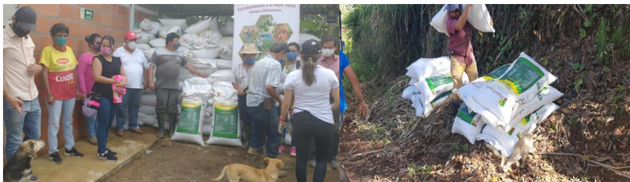
Figure 10: Registros fotográficos de la entrega de biofertilizante en el municipio de Armero Guayabal.

El día 25 de noviembre se realizó un avance de la entrega de fertilizantes a víctimas del conflicto armado interno, mujeres afiliadas a la Asociación MANA, productoras de maíz, papaya, frijol y otros productos, proceso que será concluido una vez se recoja el producto pendiente por retirar de las bodegas de la compañía avícola Triple A.