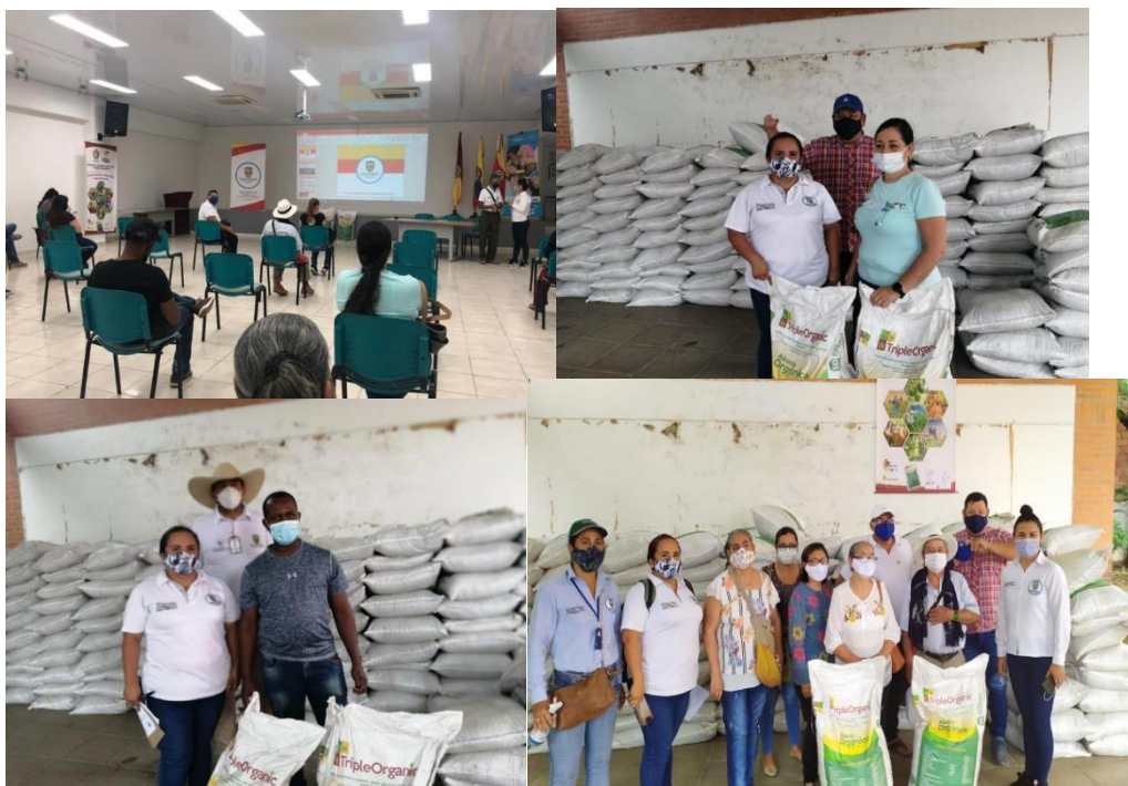
Figure 2: Registros fílmicos de las evidencias de entrega y Asistencia Técnica Municipio de Melgar